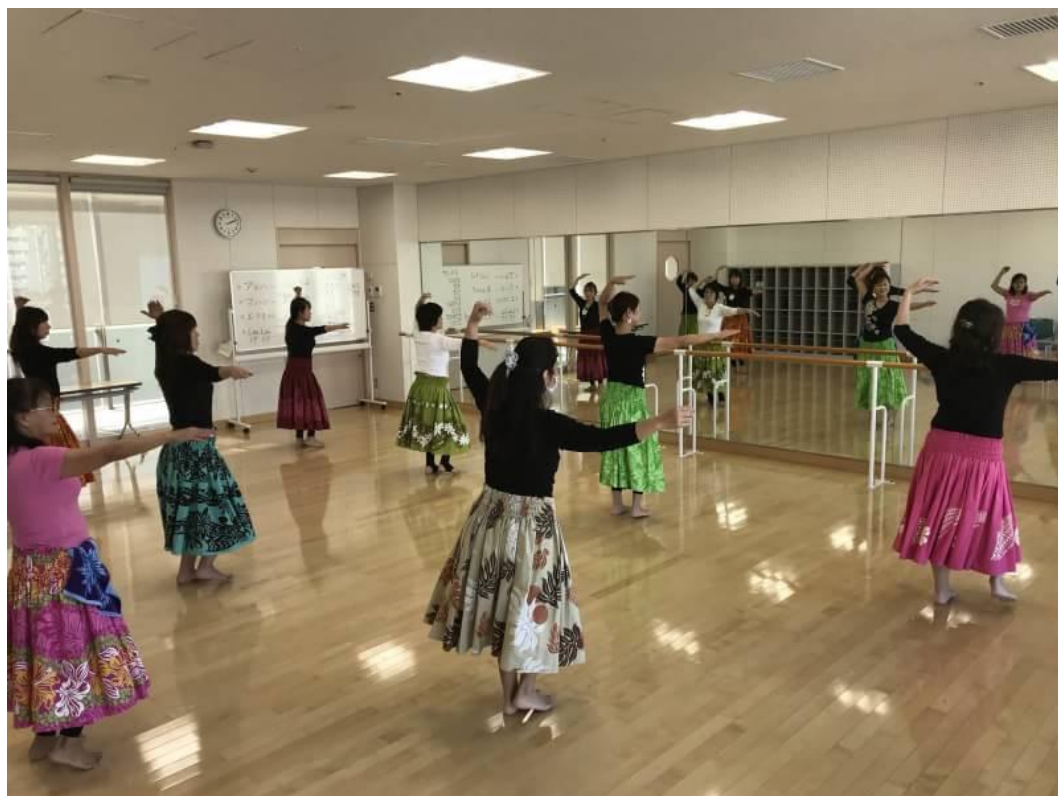
フラダンス教室活動風景 於) 美園コミュニティセンター