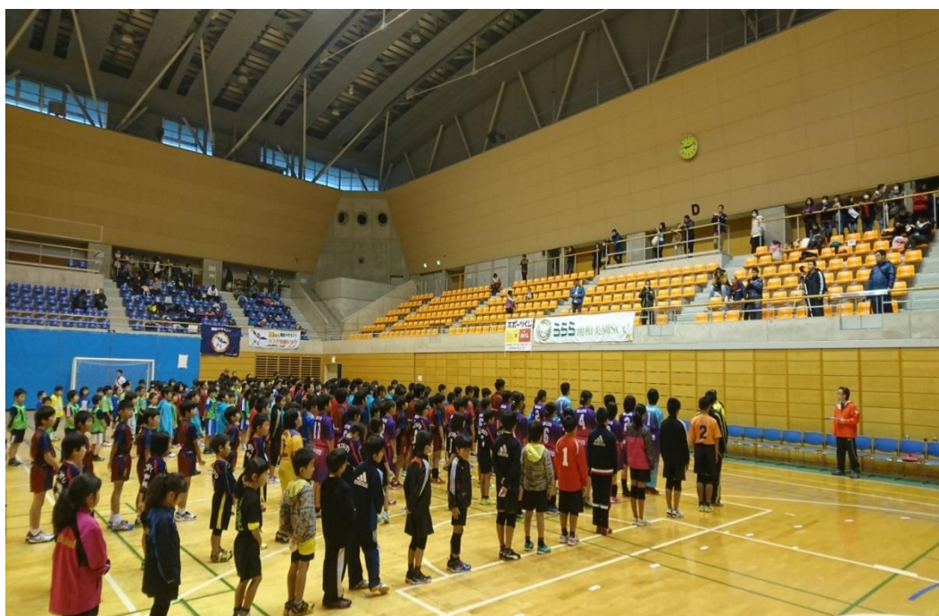
2017.11.23 第6回Jrハンドボール大会開会式 於)サイデン化学アリーナ