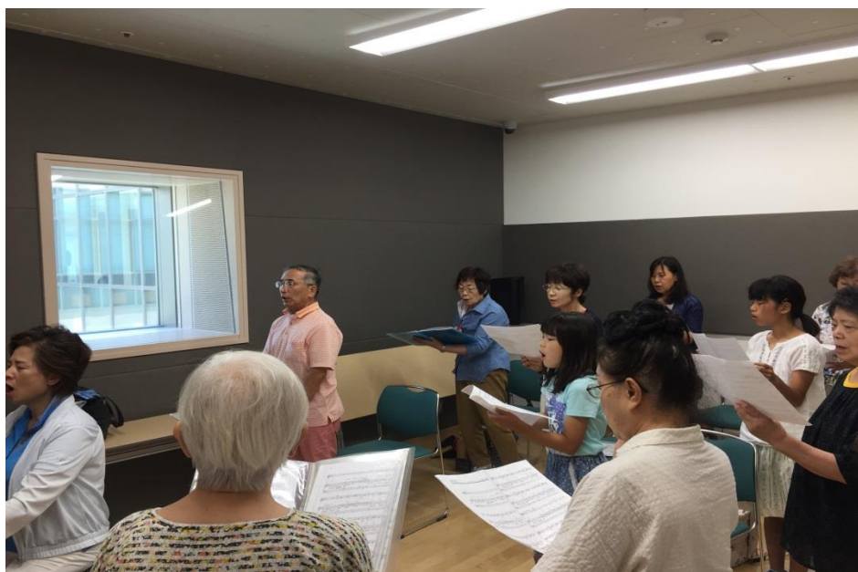
文化（カルチャー）歌の部屋 於）美園コミュニティセンター