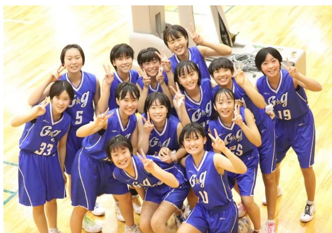
バスケットボール (U-15女子)