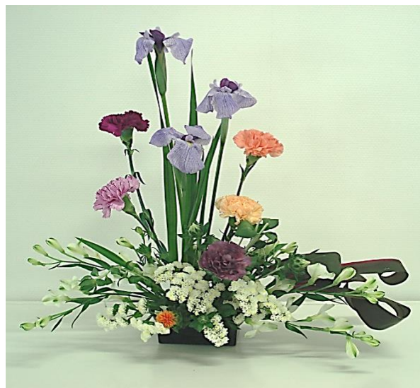
カルチャー（文化）作品 フラワーアレンジメントの部屋