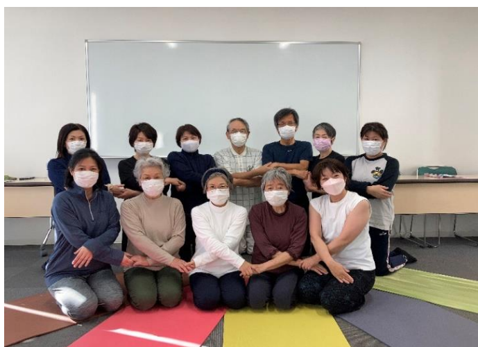
ヨガ教室（月曜ヨガ；シニア&初心者コース）