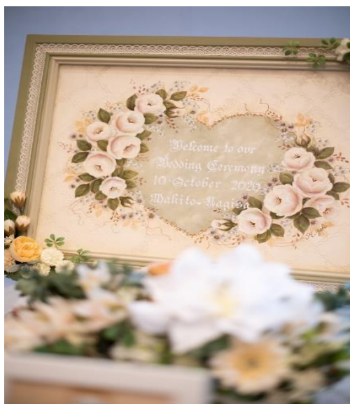
トールペイントの部屋