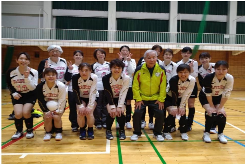
第11回浦和美園 SCC バレーボール大会 準優勝