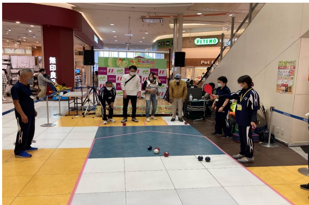
ボッチャ体験会風景