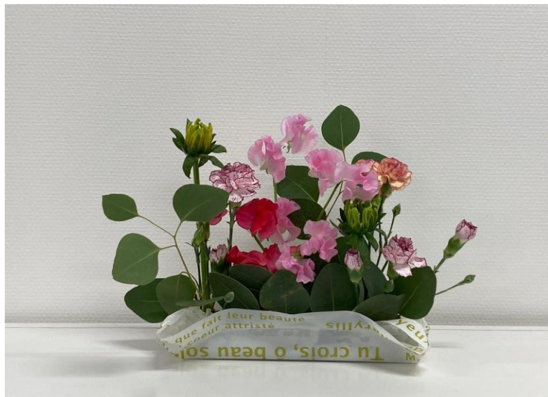
文化（カルチャー）作品 フラワーアレンジメント