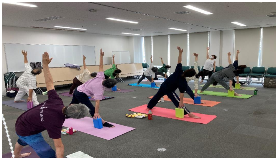
ヨガ教室 活動風景 月曜ヨガ；シニア&初心者コース