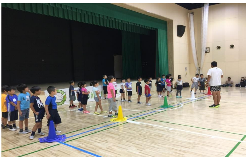
かけっこ教室 於) 美園コミュニティセンター