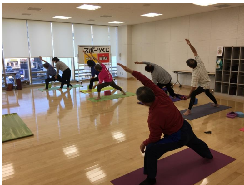
ヨガ教室（月曜日）活動風景 於）美園コミュニティセンター